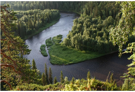
Fahrstrecke: Kuhmo–Juntusranta ca. 170 km

Sie fahren weiter auf den Spuren des Winterkrieges 1939-1940. 25 km südlich von Suomussalmi ist das historische Gebiet Raate, wo harte Kämpfe des zweiten Weltkriegs stattgefunden sind. In Raate können Sie eine Ausstellung zum Winterkrieg zwischen Finnland und Sowjetunion sowie das Raate Grenzsoldaten-Museum besichtigen.